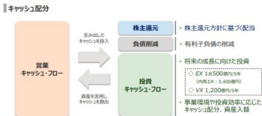
図 関西電力グループ中期経営計画（2021-2025）のアップデート キャッシュ配分