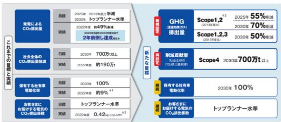
図 ゼロカーボンロードマップ ロードマップの全体像