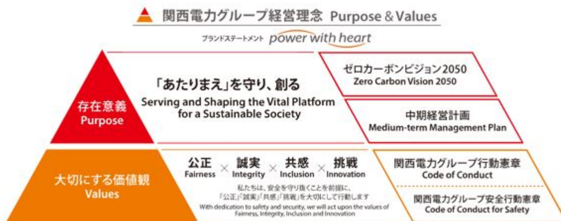
図 関西電力グループ 経営理念 (Purpose & Values) ・ブランドステートメント (power with heart)

当社は、2021年3月に、新たな経営理念として「関西電力グループ経営理念 Purpose & Values」を策定しました。本経営理念は、当社グループの最上位概念として、お客さまや社会にとっての「『あたりまえ』を守り、創る Serving and Shaping the Vital Platform for a Sustainable Society」という存在意義のもと、「『公正 Fairness』『誠実 Integrity』『共感 Inclusion』『挑戦 Innovation』」という価値観を大切に事業活動を行い、持続可能な社会を実現することを掲げています。